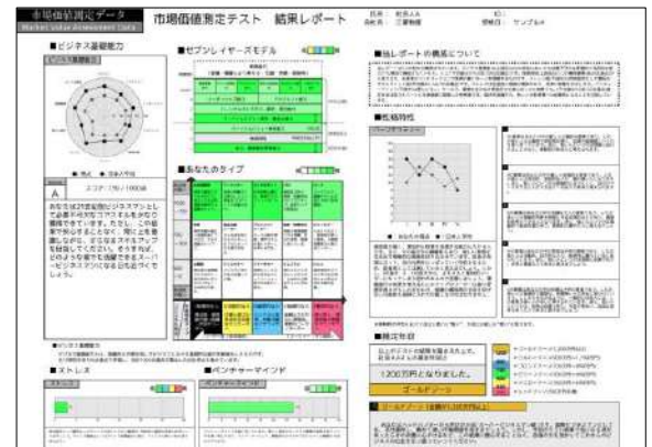
結果サンプル (ダイジェスト版)